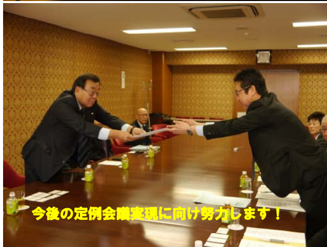
今後の定例会議実現に向け努力します!